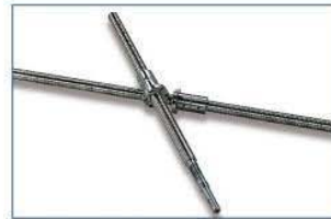
精密滾珠螺桿 X,Y 軸採用預壓式雙螺帽精密滾珠螺桿, 押送平順, 背隙小, 定位極佳。