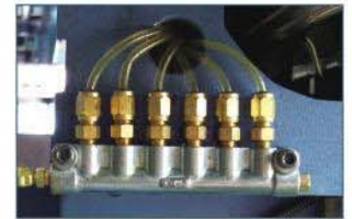
注油閥 X,Y,Z三軸各滑道及螺桿, 各部供油充分均勻, 齒輪及軸承為採用數字顯示型注油機。 電動昇降座, 升降速度快, 採用1HP馬達驅動, 每分鐘高達1150mm。 Lubrication oil control valve Pressure-reserved lubrication oil control valves are installed as standard to control lubrication oil supply as even as possible to ballscrew, Gear and 3 axes.