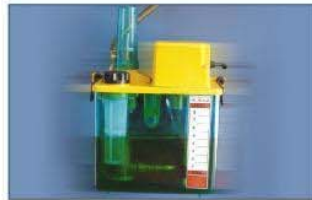
SMA間歇式潤滑系統 Intermittence Lubrication System